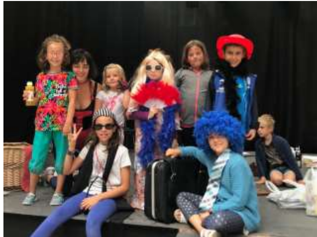
Un momento que recoge el final del taller en el escenario del Patio de los Gigantes

http://noticias.ipesmujeres.org/2018/07/cuentacuentos-participativos-en-euskera-parte-hartzeko-ipuin-saioa-euskaraz/