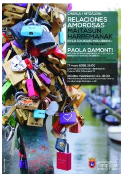
Folleto anunciador del acto

A iniciativa del Área de Igualdad del Ayuntamiento de Pamplona y en colaboración con el Centro de Documentación-Biblioteca de Mujeres de IPES, el jueves 17 de mayo a las 18:00 horas, la doctora en Intervención Social y Estado de Bienestar y Experta en Género, Paola Damonti realizó la charla: Relaciones amorosas en la sociedad neoliberal . Compartió con el público asistente, sus análisis y reflexiones sobre como las relaciones amorosas se ven influidas por la existencia del sistema sexo-género en el marco de un modelo socio-económico que acrecienta las desigualdades económicas y sociales. Participaron 26 personas, el 80% mujeres.